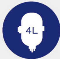
大容量不鏽鋼熱桶