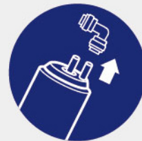
省時便利快拆濾芯