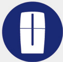
全機防護外殼設計