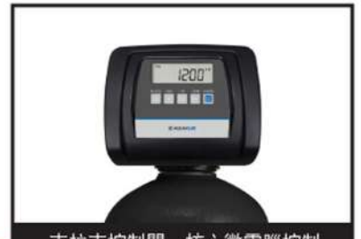
克拉克控制閥，核心微電腦控制