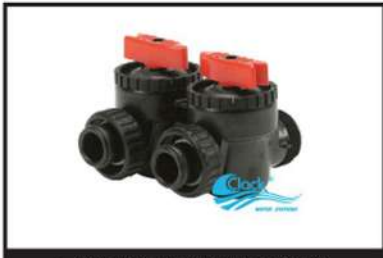
可選配克拉克原廠旁通閥