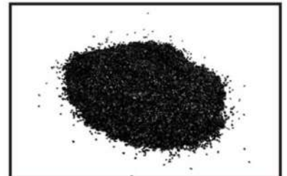
NSF認證椰殼活性炭(除氯)