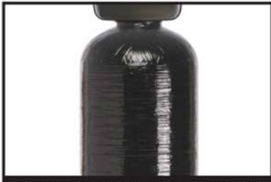
NSF認證玻璃纖維桶，耐壓性高