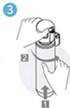
逆時針將 濾心裝上