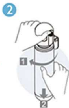
順時針將 濾心轉出