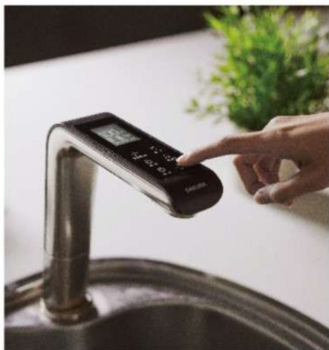
智能觸控顯屏 清晰高質感 簡單好操作