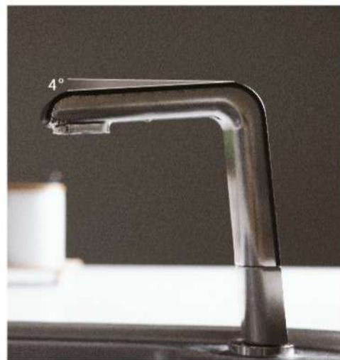
4度傾斜介面 絕佳視角不反光