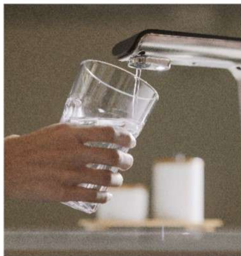
輔助照明 貼心設計 安心取水