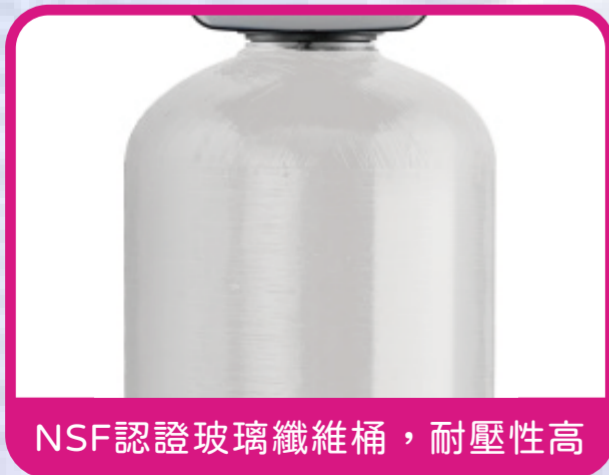
NSF認證玻璃纖維桶，耐壓性高