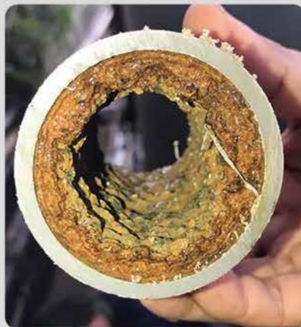
全戶管線雜質堵塞