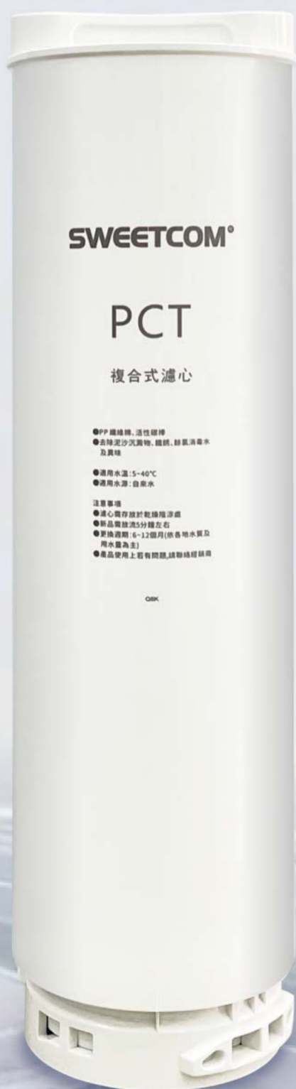
第一道 PCT複合式濾芯